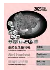
英語・中国語版(日本語併記) 2023(令和5)年3月発行