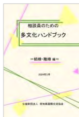
結婚・離婚編 2024(令和6)年3月発行

https://www2.aia.pref.aichi.jp/sodan/j/manual/manual.html