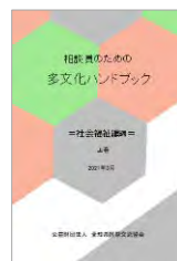
社会福祉編(上巻) 2022(令和4)年3月発行