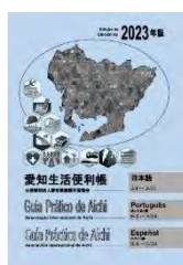
ポルトガル語・スペイン語版(日本語併記) 2023(令和5)年9月発行

外国人がこの地域で生活するのに役立つ情報を集めた冊子です。ポルトガル語、スペイン語、英語、中国語に日本語を併記して作成しています。在留手続きから、保険、医療、教育、仕事、税金などの制度を紹介するほか、各種相談窓口も掲載しています。