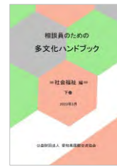
社会福祉編(下巻) 2023(令和5)年3月発行