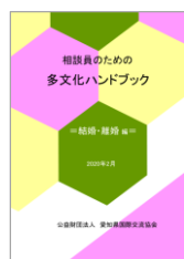
結婚・離婚編 2020(令和2)年3月 発行

http://www2.aia.pref.aichi.jp/sodan/j/manual/manual.html