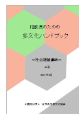
社会福祉編(上巻) 2022(令和4)年3月 発行