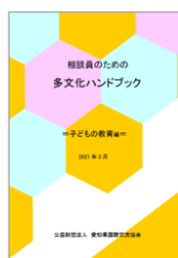
子どもの教育編 2021(令和3)年3月 発行