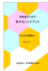
子どもの教育 編 2021(令和3)年3月 発行