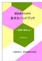
結婚・離婚 編 2020(令和2)年3月 発行