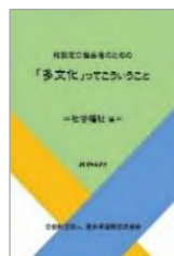
社会福祉 編 2018(平成29)年2月 発行

http://www2.aia.pref.aichi.jp/sodan/j/manual/manual.html