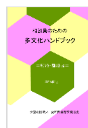
結婚・離婚 編 2020(令和2)年3月 発行