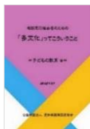
子どもの教育 編 2017(平成28)年3月 発行

http://www2.aia.pref.aichi.jp/sodan/j/manual/manual.html