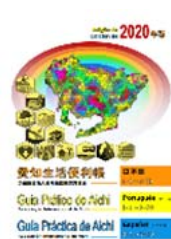
ポルトガル語・スペイン語版(日本語併記) 2020(令和2)年3月 発行

当協会あいち多文化共生センターにて無料(1冊)で配布するほか、ホームページからもダウンロードできます。