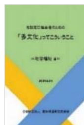
社会福祉 編 2018(平成29)年2月 発行