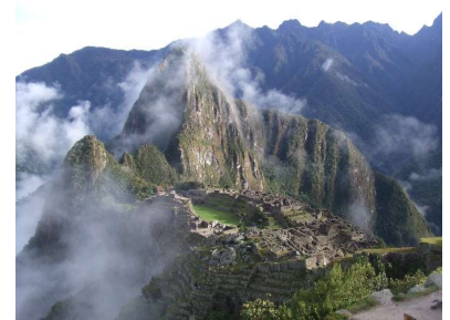
世界遺産「マチュピチュ」→

ブースではより詳しくペルーを知ることができます！ぜひお越しください。 お待ちしております♪