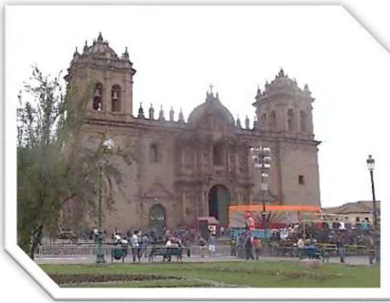
クスコ大聖堂 (カトリック)