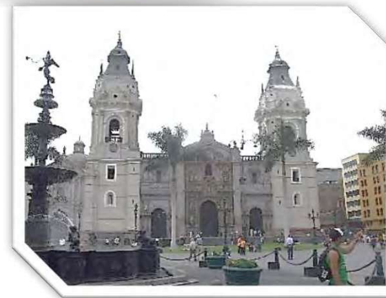
リマ大聖堂 (カトリック)