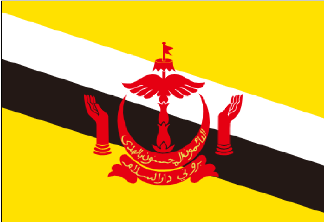
ブルネイ・ダルサラーム国 Brunei Darussalam