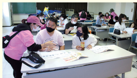
▲マイ・タイムラインを作成中の参加者