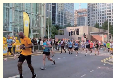
▲ロンドンマラソンの様子

これまで私が参加した中では、ワイナリーのブドウ畑の中を走りながら、給水ポイントではそこで収穫されたブドウを使って作られたワインの試飲が提供される飲兵衛イベントや、クリスマス時期に参加者全員がサンタのコスチュームを着て、大量のサンタがランニングするサンタランがありました。