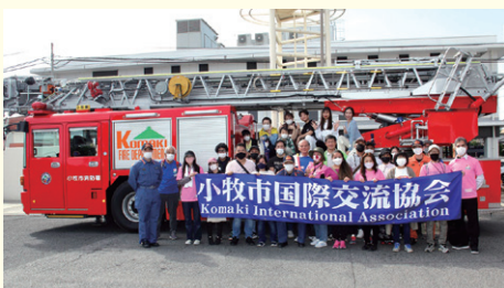
▲防災訓練に参加した外国人とボランティアのみなさん

今後もイベント、講座等を通じて外国の方と日本の方がともに生きていける地域づくりのお手伝いをしていきたいと思っています。