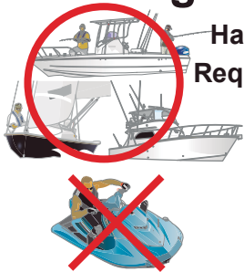
Barco a motor ou a vela

Material a ser fornecido: 1- Apostila 2- Exemplos de exames anteriores